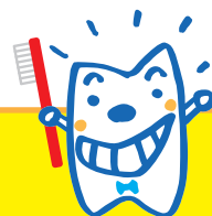
イメージキャラクター でん太